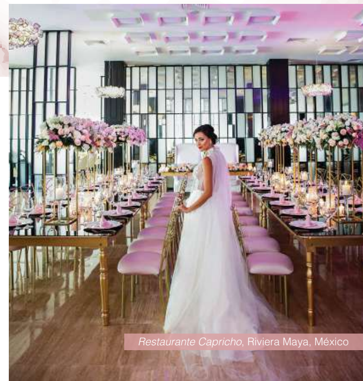
Restaurante Capricho , Riviera Maya, México