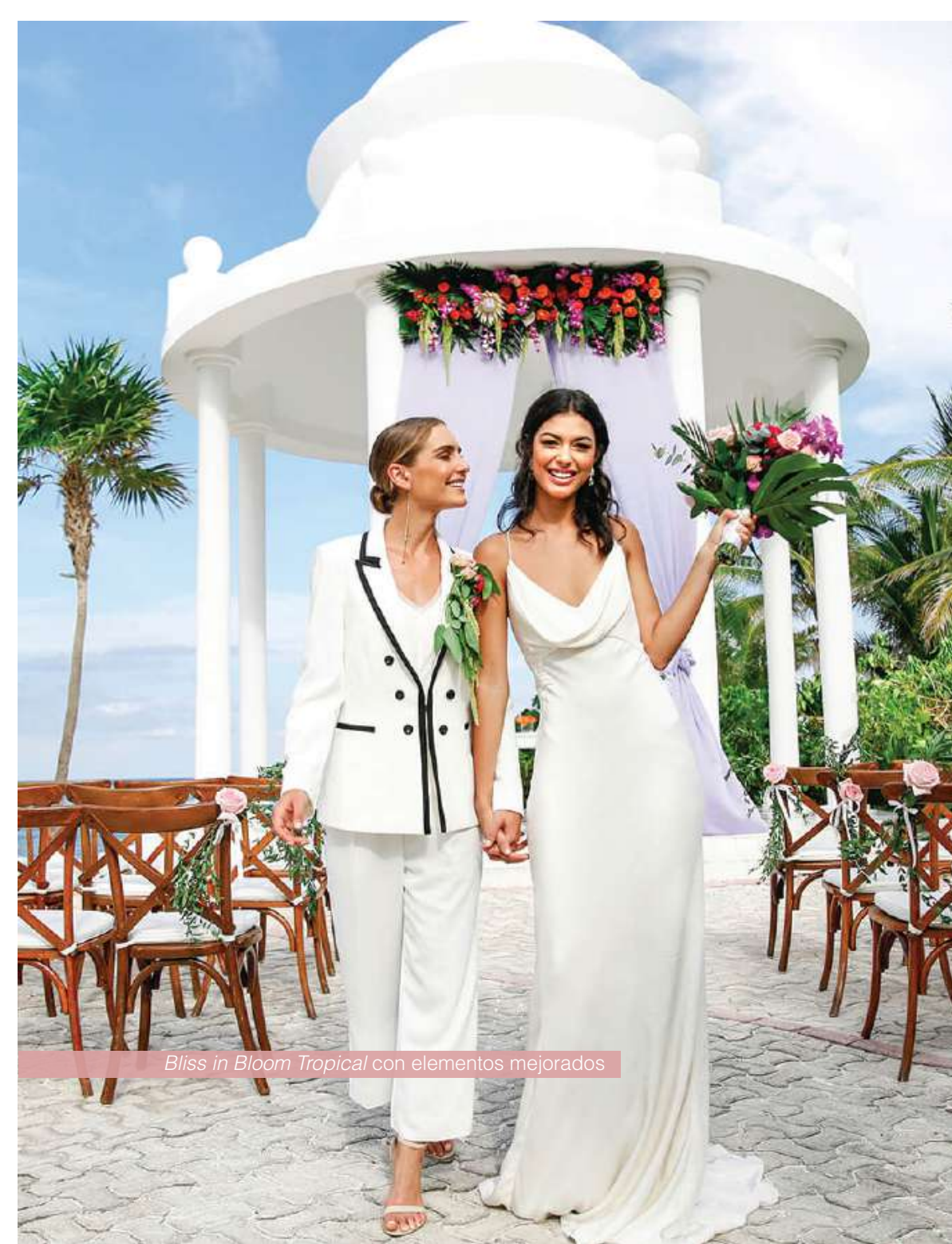
Bliss in Bloom Tropical con elementos mejorados