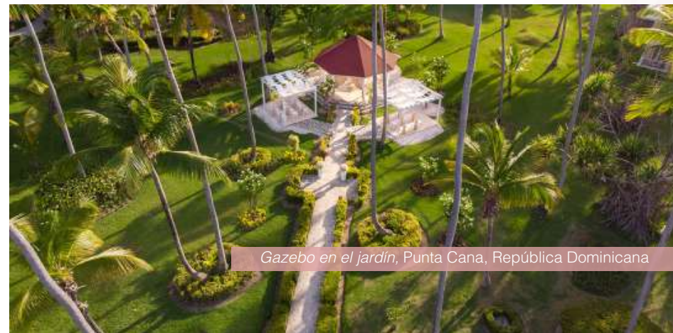
Gazebo en el jardín, Punta Cana, República Dominicana