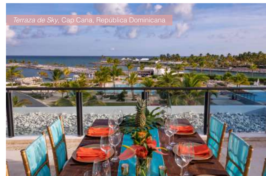
Terraza de Sky, Cap Cana, República Dominicana