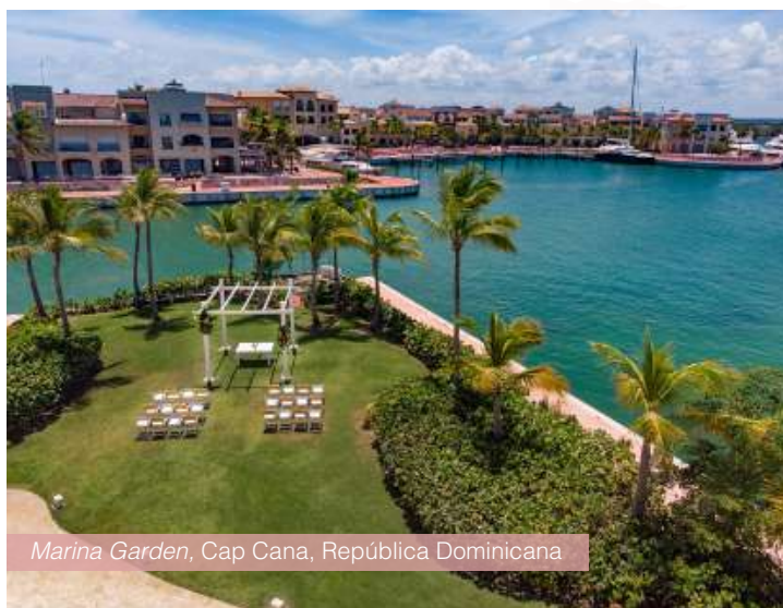
Marina Garden, Cap Cana, República Dominicana