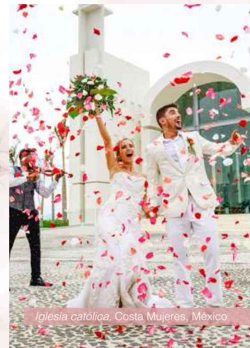
Iglesia católica, Costa Mujeres, México